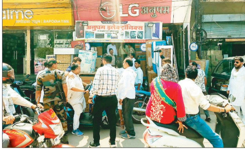
अतिक्रमण हटाने पहुंचे ट्रैफिक अमले को समझाइसा देते नगर के पार्षद।