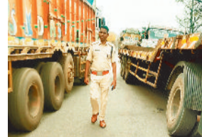
सड़क पर वाहन खड़ी करने वाले 14 वाहन चालकों का चालान काटा गया जिसमें 14 वाहनो से 27,000 का समान शुल्क की वसूली की गई

रायगढ़। तमनार क्षेत्र में सड़क निर्माण होने से इन दिनों रायगढ़-पूँजीपथरा मार्ग पर भारी वाहनो का दबाव अधिक है। 19 मार्च को पूँजीपथरा मार्ग पर अव्यवस्थित भारी वाहनो से मार्ग बाधित थी। यातायात पुलिस के जवान यातायात व्यवस्था बनाने में जुटे थे। उसी समय यातायात डीएसपी रमेश चन्द्रा स्टाफ के साथ मौके पर पहुंचे। इस दरमियान मार्ग को बाधित कर