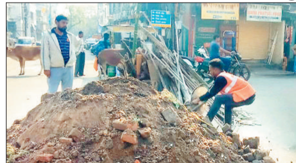
से मिट्टी के ऊपर ही होलिका बनाने और होलिका दहन करने की निगम

रायगढ़। रंगो का त्यौहार होली के धूमधाम मानने तैयारी जोर शोर चल रही है। मोहल्ले मोहल्ले में होलिका बनाई जा रही है। शहर के कुछ स्थानों पर बड़े रूप में होलिका दहन किया जाता है। इसमें शहीद चौक, गौरीशंकर मंदिर चौक, कारागिर चौक शामिल है। डामरीकृत सड़क को किसी प्रकार का नुकसान ना हो इसके लिए तीनों स्थानों पर सड़कों पर मिट्टी डलवाया गया और वहां स्थित लोगों एवं व्यापारी संस्थाओं