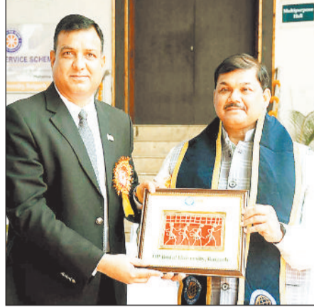
महोत्सव में आमंत्रित विभिन्न प्रांतों के वक्ताओं का संबोधन व सम्मान।